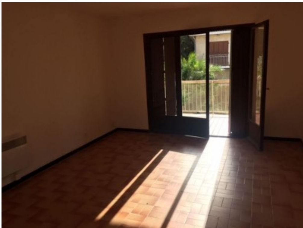
T3 traversant avec Garage - SIX FOURS Centre Ville

Logement situé au 1er Etage composé d'un hall d'entrée, une cuisine avec balcon, deux chambres, une salle de bain, un wc, un salon donnant sur une terrasse.